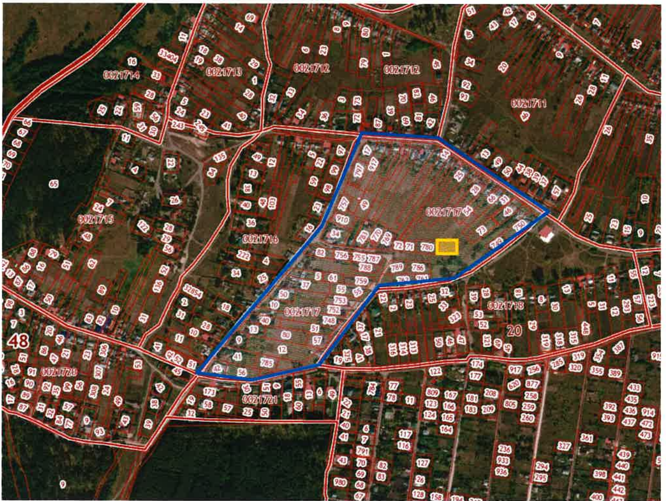
Схема границ внесения изменений в проект планировки и проект межевания района, ограниченного улицами Ленина-Советская-Сиреневая-Луговая (Желтые Пески), в городе Липецке в части 18 квартала