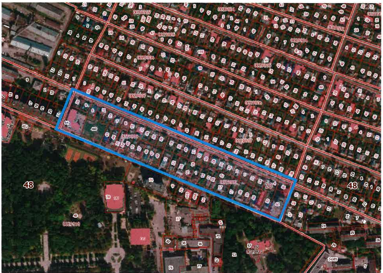
Схема границ территории квартала, ограниченного улицами Тельмана, Вавилова, проездом Шишкина в городе Липецке