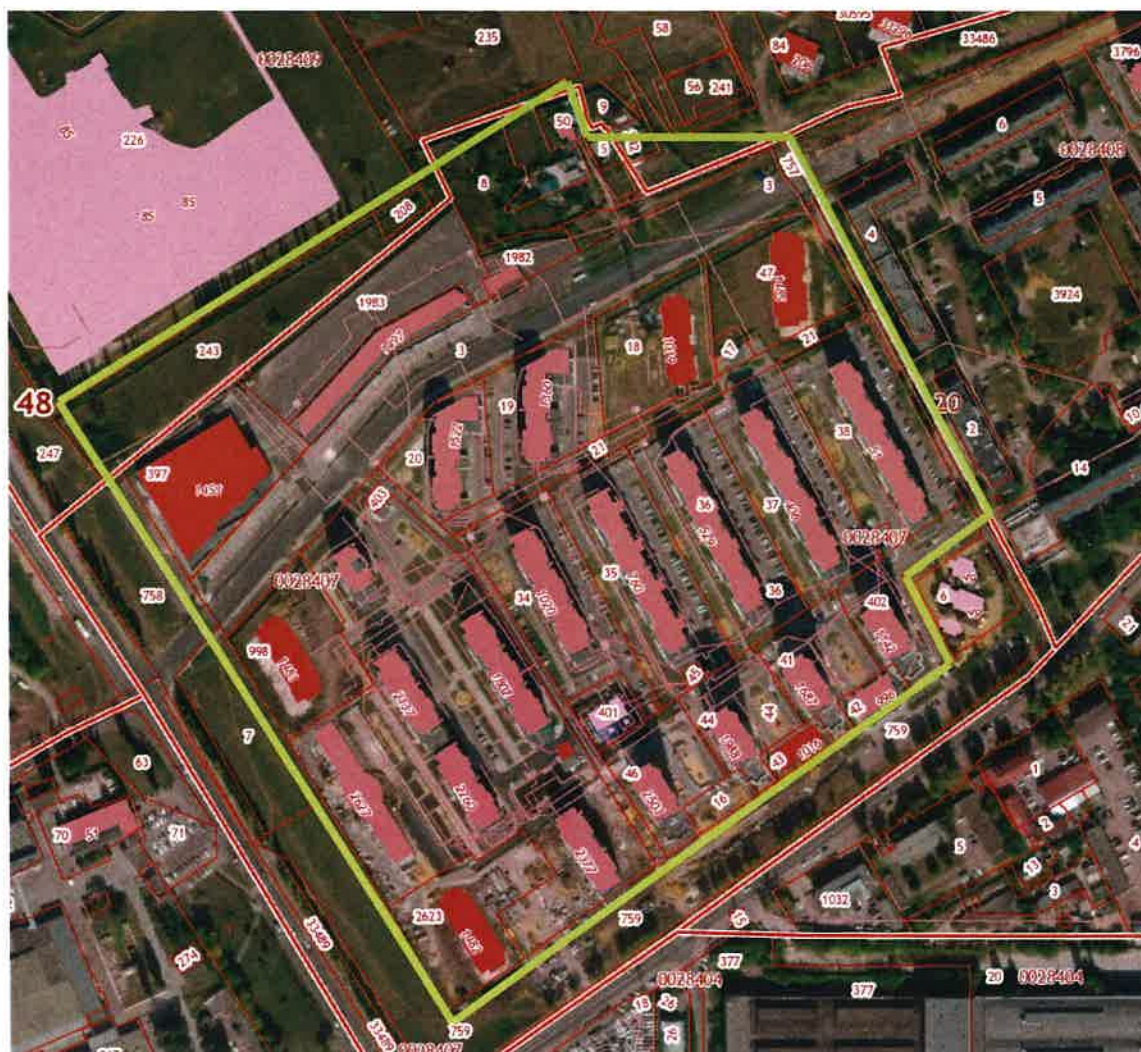
Схема границ территории жилой многоэтажной застройки в районе пересечения Лебедянского шоссе и ул. Опытной в городе Липецке