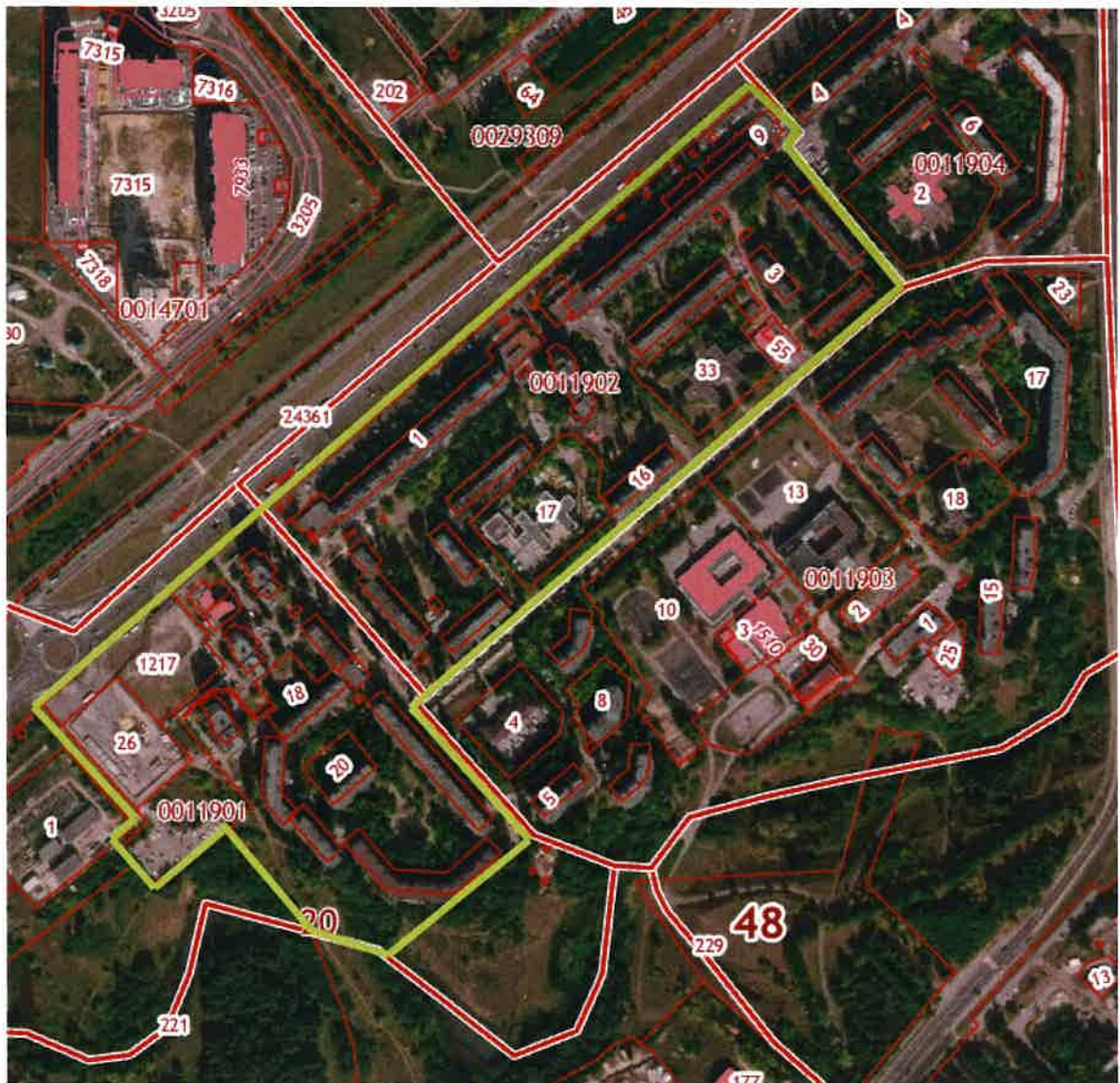
Схема границ квартала, ограниченного улицами Московская - Катукова в городе Липецке для разработки документации по планировке территории (проекта планировки и проекта межевания)