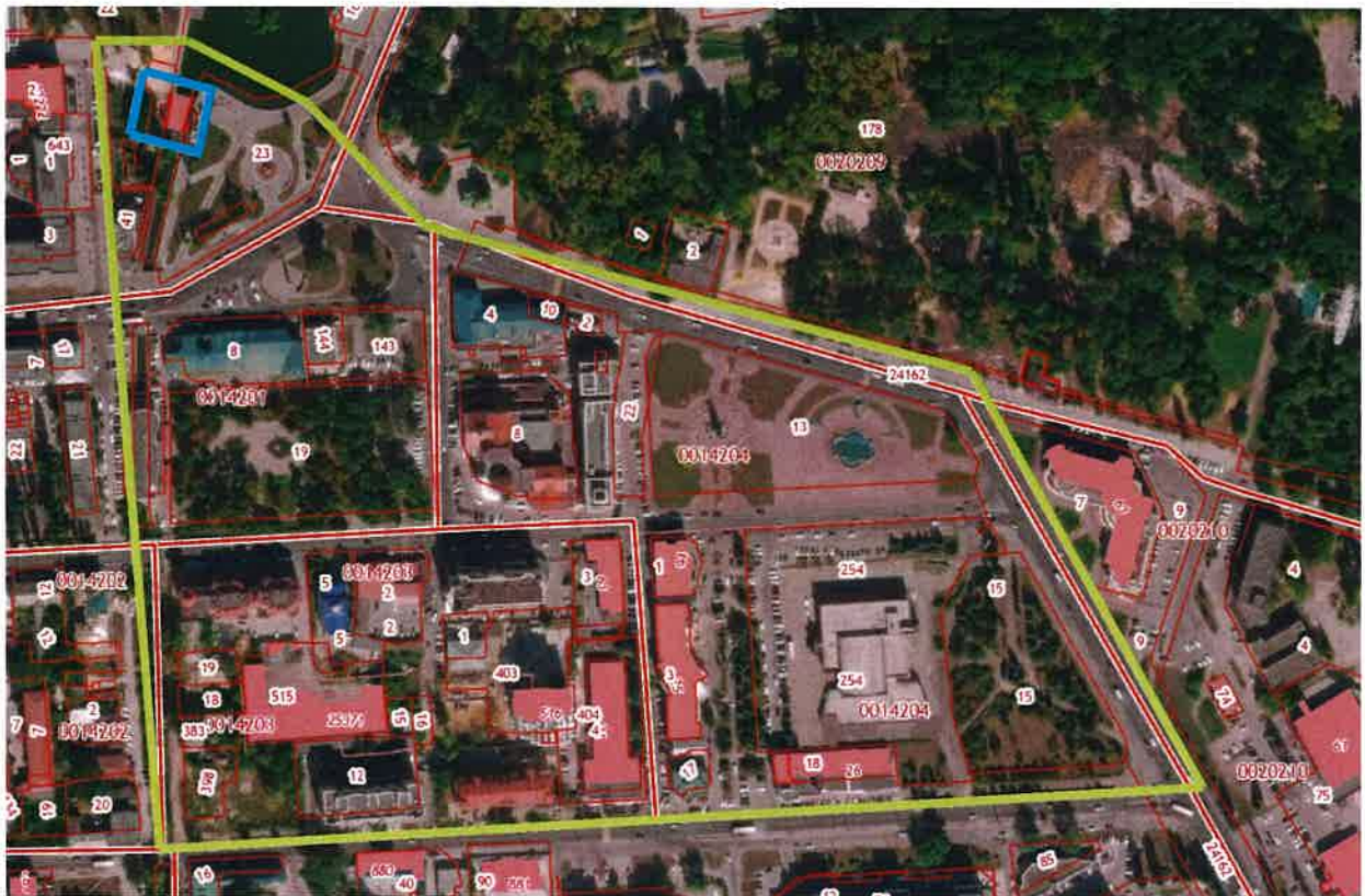
Схема границ территории жилого квартала, ограниченного улицами Валентина Скороходова, Октябрьской, площадями Петра Великого и Революции в городе Липецке для разработки проекта внесения изменений в проект планировки и проект межевания