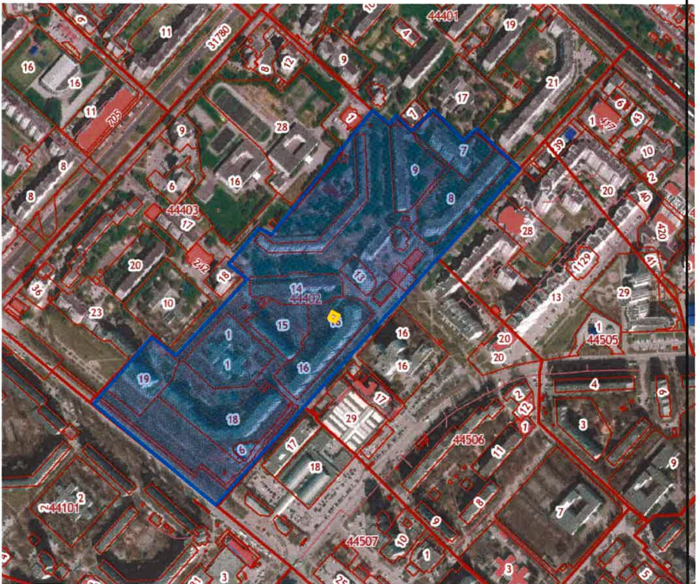
Схема проекта внесения изменений в проект планировки и проект межевания территории в границах кадастрового квартала 48:20:0044402 в районе улицы Петра Смородина в городе Липецке