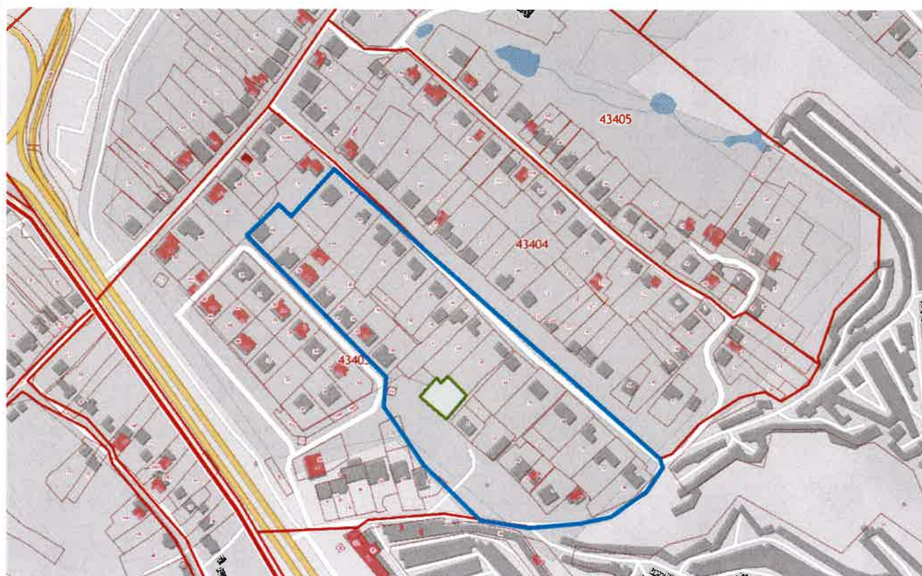
Схема границ внесения изменений в проект планировки и проект межевания жилого района, ограниченного улицами Речная, Механизаторов, проспектом Победы и Октябрьским мостом в городе Липецке в части X квартала в районе улиц Сырская и Индустриальная