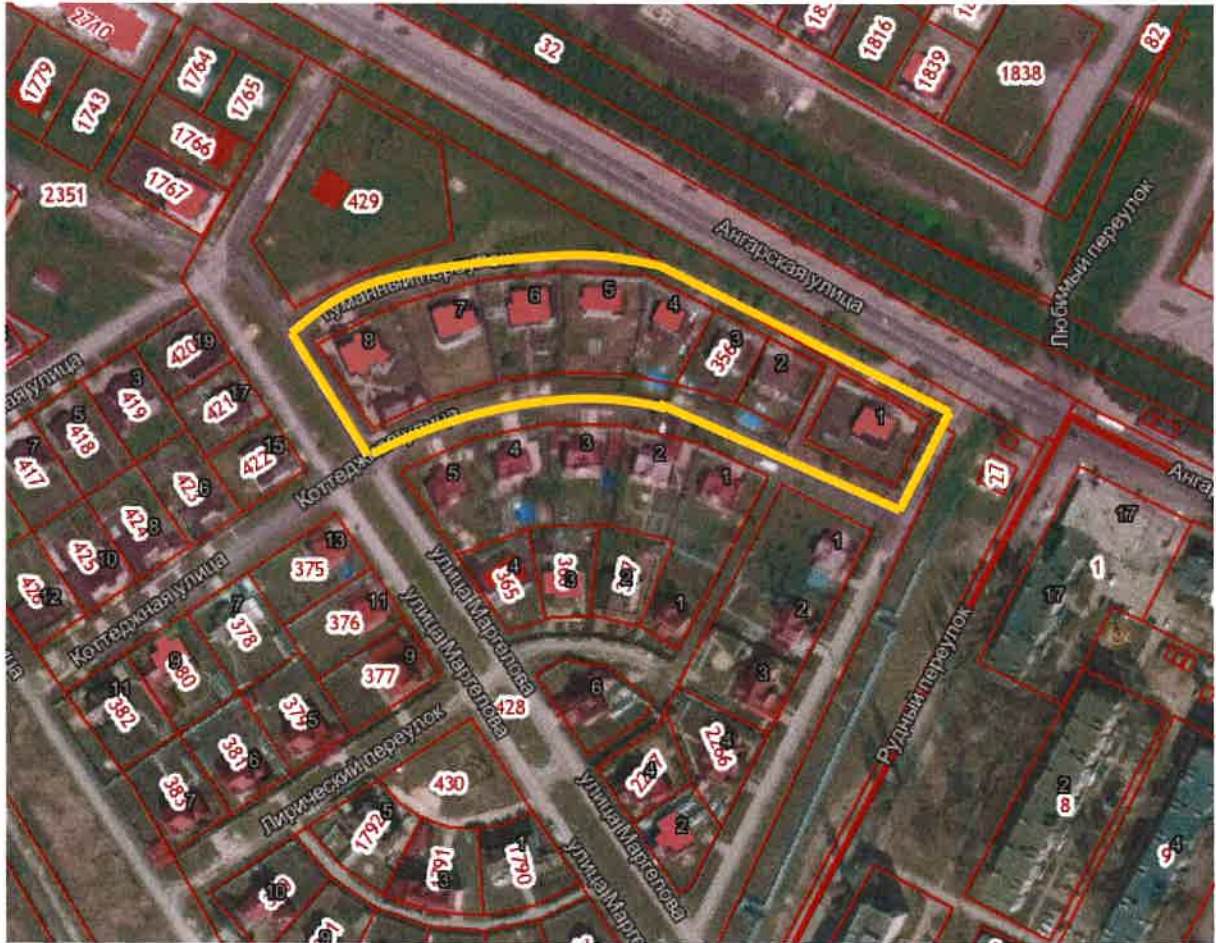
Схема границ территории квартала, ограниченного ул. Маргелова, ул. Коттеджная, ул. Романовская и пер. Туманным в городе Липецке