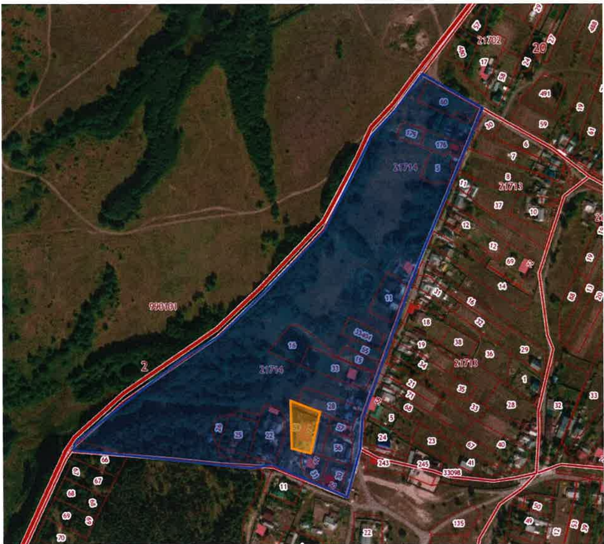
Схема границ внесения изменений в проект планировки и проект межевания района, ограниченного улицами Ленина-Советская-Сиреневая-Луговая (Желтые Пески), в городе Липецке, в части 8 и 11 кварталов