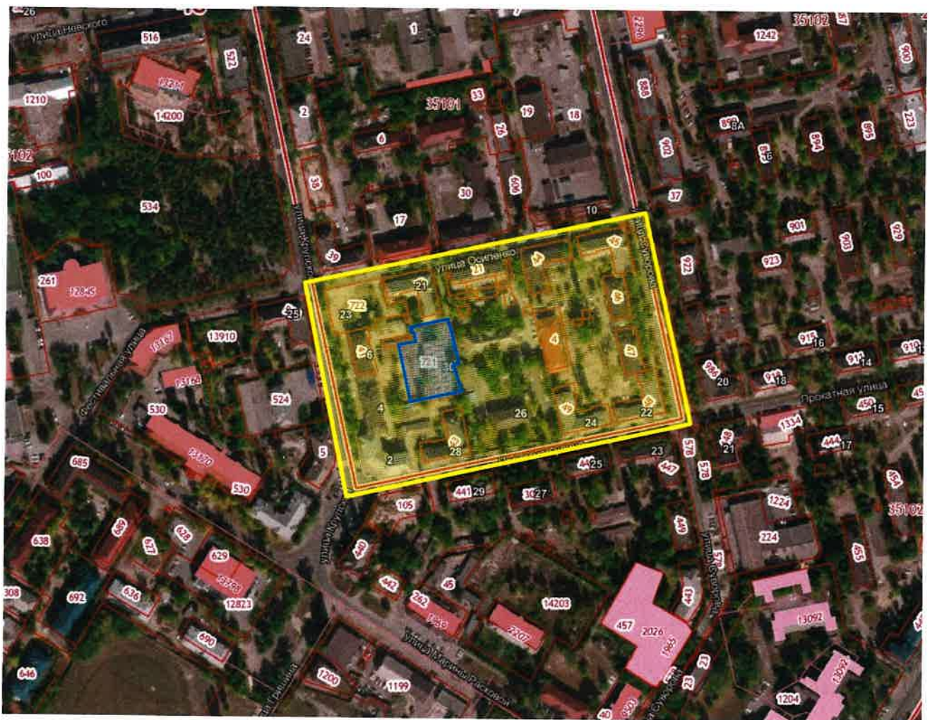
Схема границ внесения изменений в проект планировки и проект межевания территории квартала, ограниченного улицами Прокатная, Имени Н.К. Крупской, Осипенко, Суворова в городе Липецке